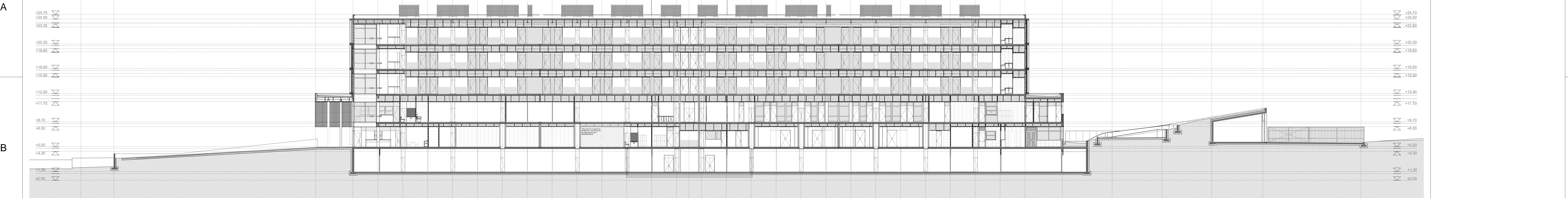
CORTE CX2 | ESC. 1-200